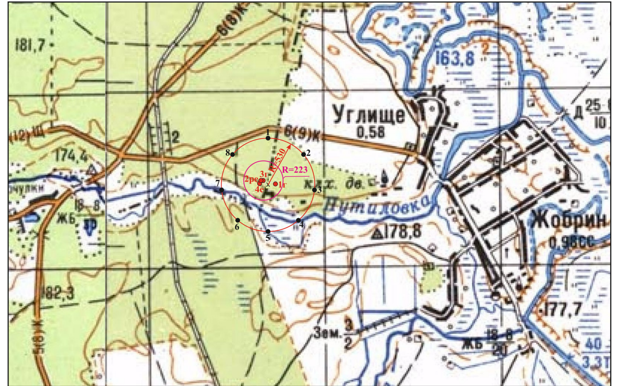
Географічні координати кутових точок ЗСО III поясу